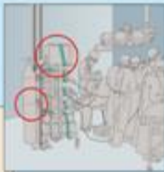
सुरक्षित तवरले बाँधिएका उपकरण