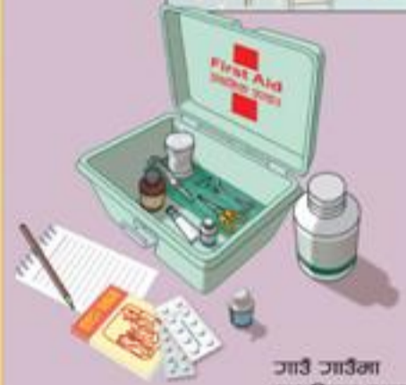
जाउँ जाउँमा प्राथमिक उपचार क्षमता