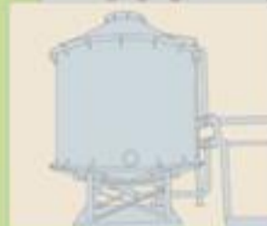
पानी, विजुली, संचार, अवसंजन आदिको अनवरत आपूर्ति क्षमता